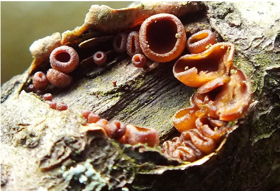
Fot. 4. Owocniki baziówki mocnej Rutstroemia firma WA0000166895. Photo 4. Ascomata of Rutstroemia firma WA0000166895.