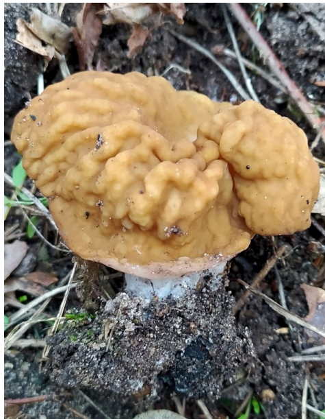
Fot. 1. Owocnik Discina gigas WA0000166889.