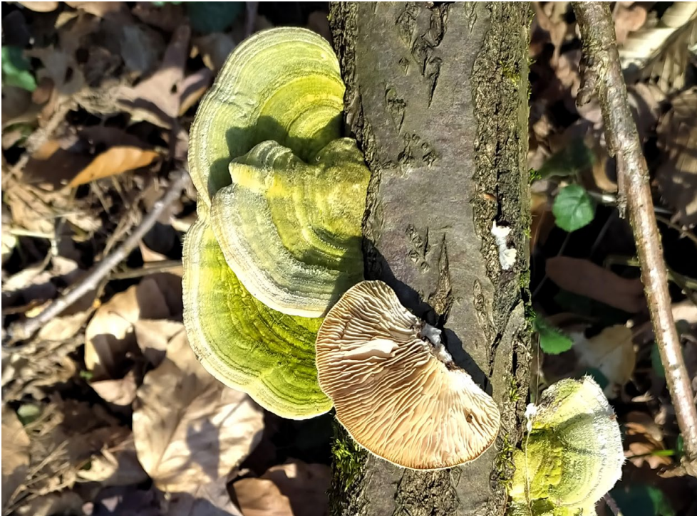
Fot. 16. Owocniki blaszkowca drobnozarodnikowego Lenzites betulinus WA0000166983 ( 03.03.2024).

BC 66, Kotlina Gorzowska, woj. wielkopolskie, pow. obornicki, gm. Oborniki,