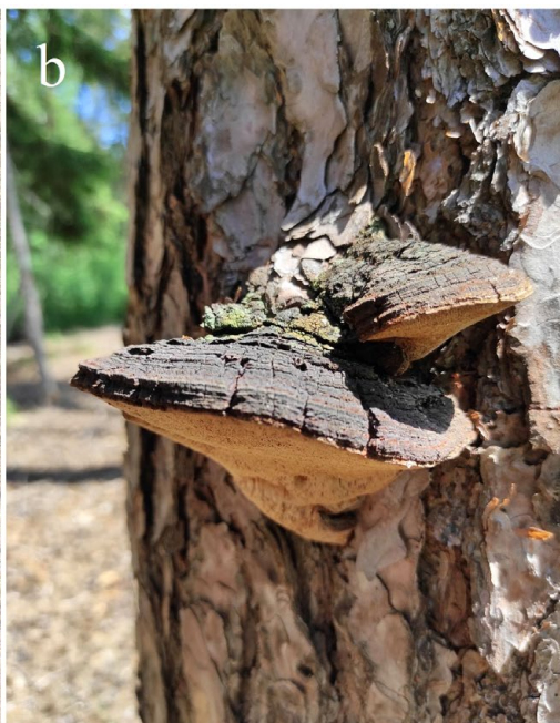
Fot. 20. Owocnik czryogmatwicy sosnowej Porodaedalea pini (a - ; 31.03.2024, b - ; 20.05.2024).