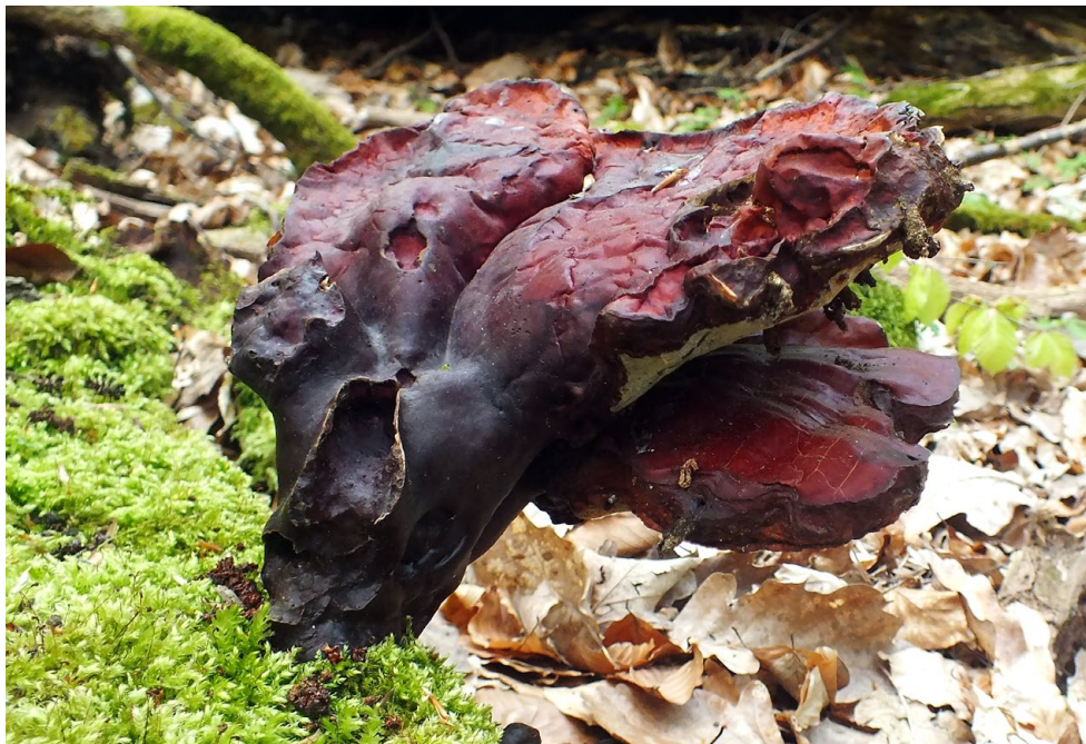
Fot. 11. Owocniki lakownicy żółtawej Ganoderma lucidum ( ; 24.04.2024). Photo 11. Basidiomata of Ganoderma lucidum ( ; 24.04.2024).