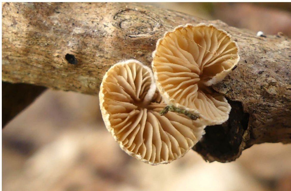
Fot. 5. Owocniki ciżmówki ciemnoblaszkowej Crepidotus cesatii var. cesatii WA0000166922.