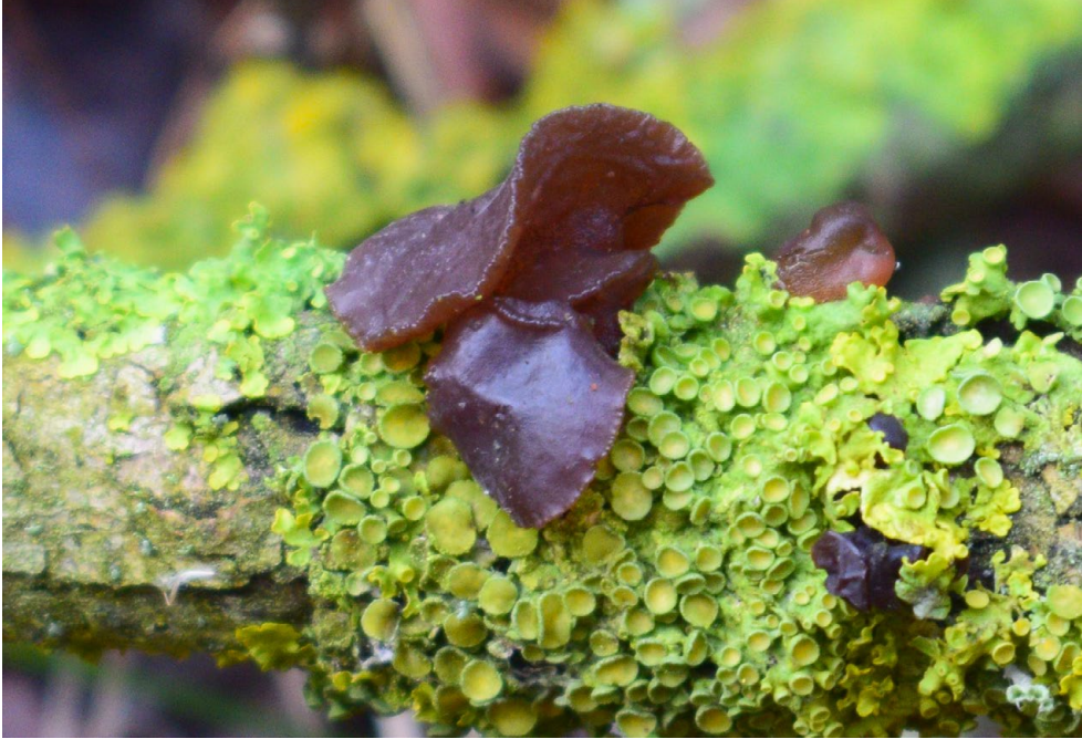
Fot. 8. Owocniki kisielnicy wierzbowej Exidia recisa WA0000166937 ( ; 01.01.2024). Photo 8. Basidiomata of Exidia recisa WA0000166937 ( ; 01.01.2024).