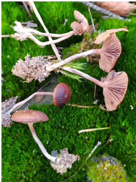
Fot. 7. Owocniki czaszówki czarnobrzowej Deconica montana WA0000166927.

Photo 7. Basidiomata of Deconica montana WA0000166927 (photo by B. Kudławiec; 03.03.2024).