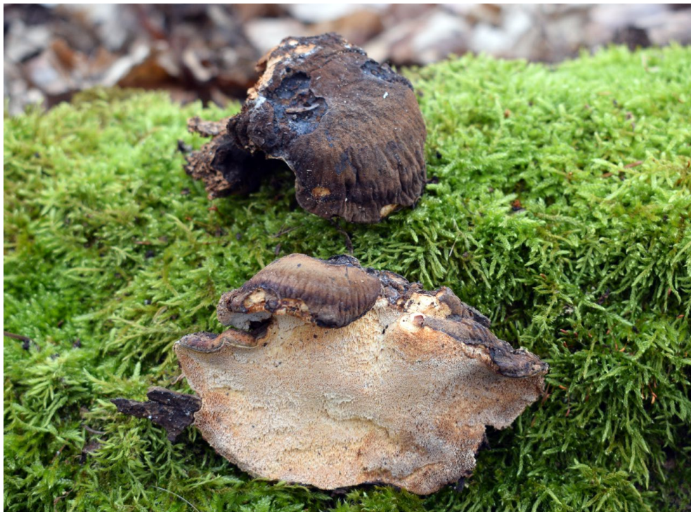
Fot. 15. Owocniki smoluchy bukowej Ischnoderma resinosem WA0000166972 ( 17.03.2024).

Photo 15. Basidiomata of Ischnoderma resinosem WA0000166972 (photo by B. Kudławiec; 17.03.2024).