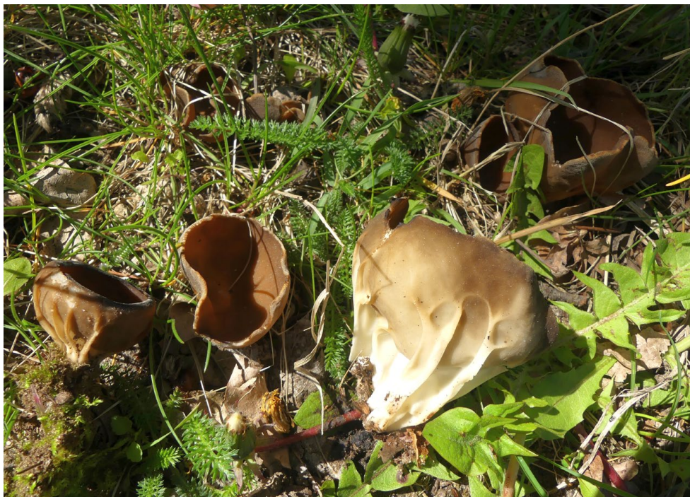
Fot. 2. Owocniki piestrzycy pucharowatej Helvella acetabulum WA0000166890 ( ; 30.04.2024).