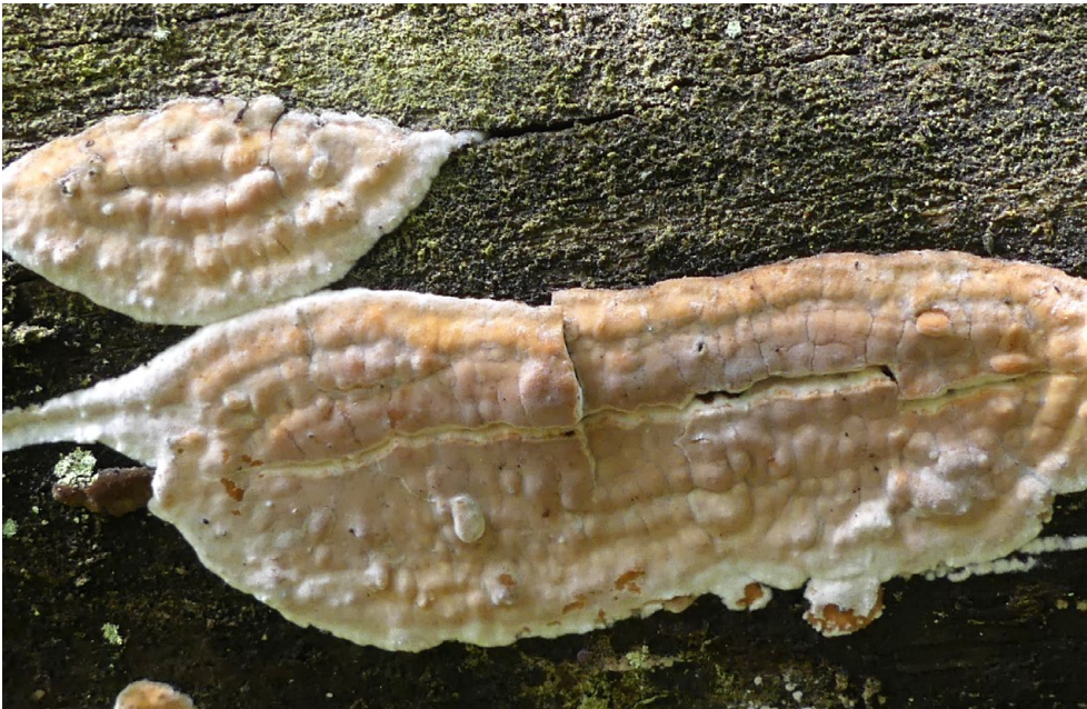
Fot. 6. Owocniki płaszczka gruzelkowanego Dacryobolus karstenii WA0000166924.

2. AB 66, Równina Nowogardzka, woj. zachodniopomorskie, pow. goleniowski, gm. Osina, Osina, N 53.6137, E 15.0305, bór mie-