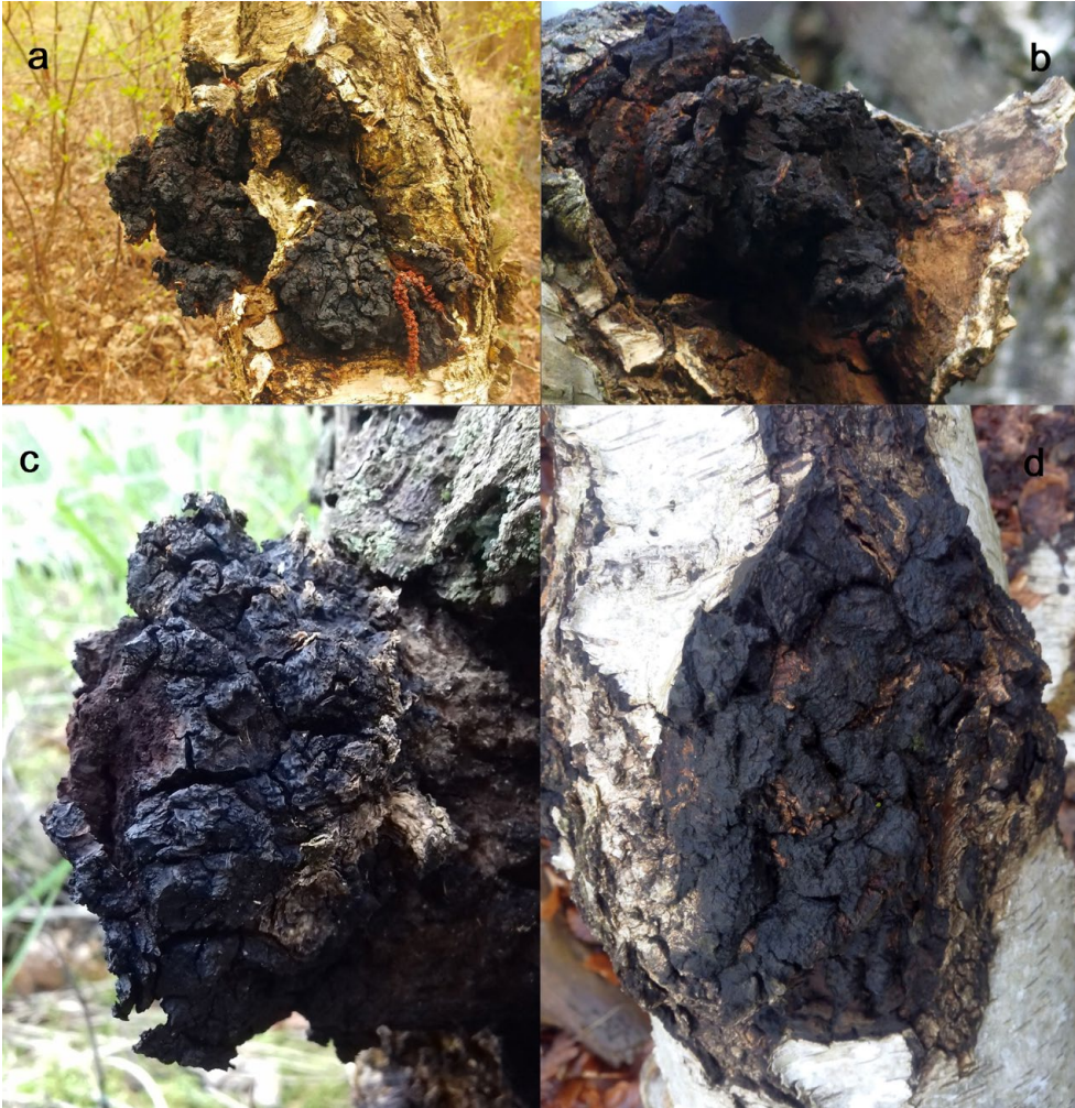
Fot. 14. Skleroty (anamorfy) błyskoporka podkorowego Inonotus obliquus (,,).