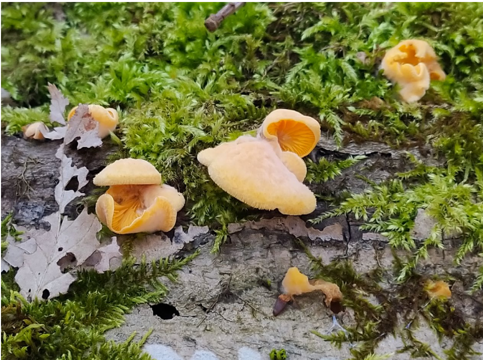
Fot. 19. Owocniki boczniaczka pomarańczowożółtego Phyllotopsis nidulans WA0000167010 ( ; 03.03.2024).

2. BC 66, Kotlina Gorzowska, woj. wielkopolskie, pow. obornicki, gm. Oborniki, Stobnica, N 52.7291, E 16.6224, bór mieszany, gałąź uschniętego krzewu liściaste-