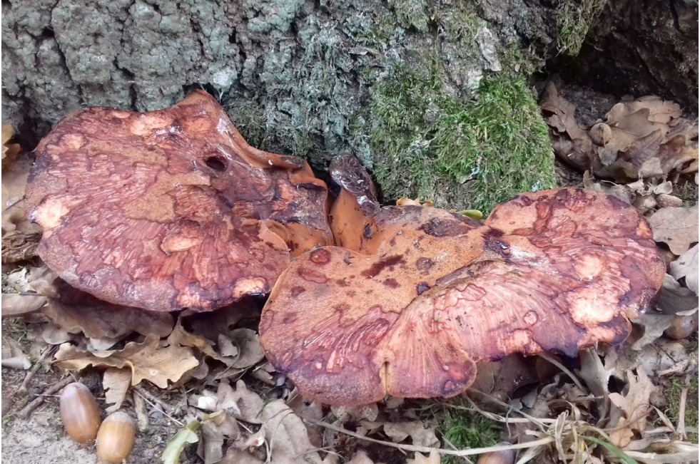
Fot. 9. Owocniki ozorka dębowego Fistulina hepatica. Photo 9. Basidiomata of Fistulina hepatica s.