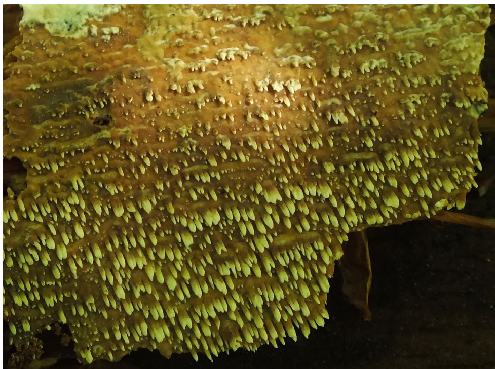
Fot. 17. Owocniki Mycoacia nothofagi WA0000166991.