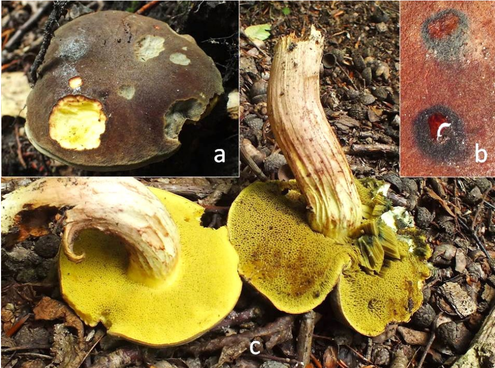
Fot. 21. Owocniki podgrzybka grubosiatkowanego Xerocomus ferrugineus WA0000167064, a) powierzchnia kapelusza, b) przebarwienia pod wpływem \text{NH}_4\text{OH}, c) hymenofor i trzon ( ; 19.07.2021).