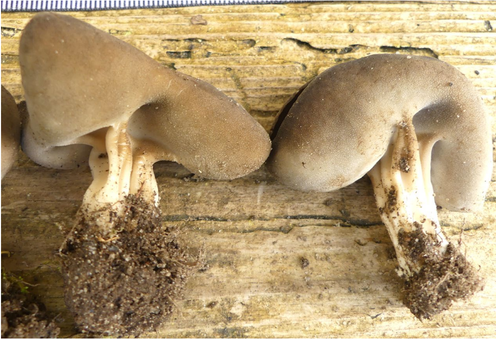
Fot. 3. Owocniki Helvella solitaria WA0000166893 ( 09.04.2024). Photo 3. Ascomata of Helvella solitaria WA0000166893 ( 09.04.2024).