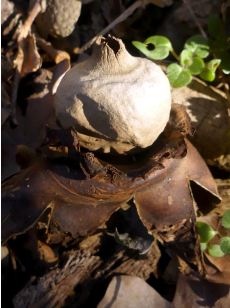
Fot. 13. Owocnik gwiazdosza potrójnego Geastrum triplex WA0000166955 ( ; 24.02.2024).

Photo 13. Basidioma of Geastrum triplex WA0000166955 ( ; 24.02.2024).