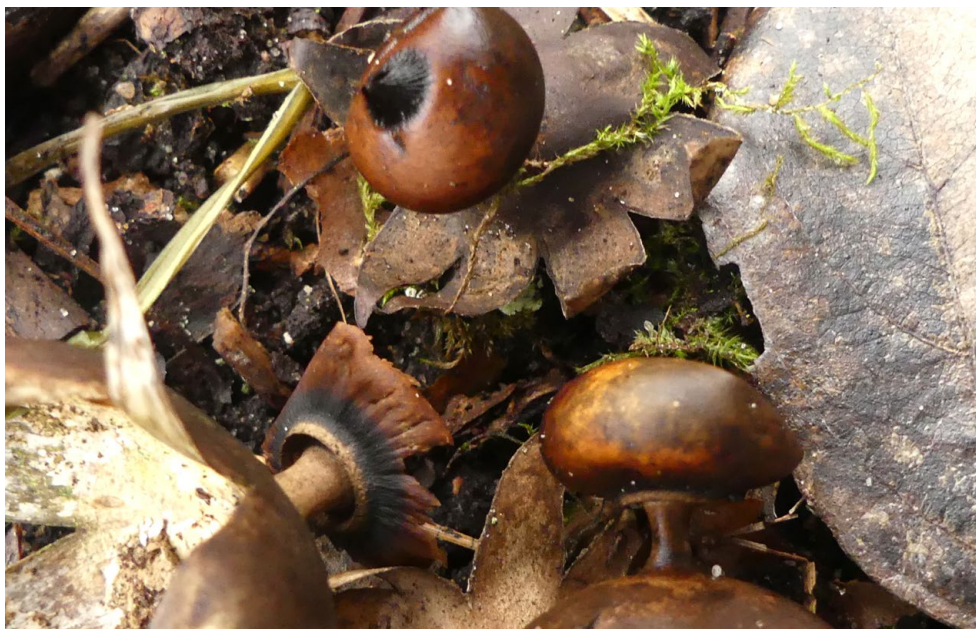
Fot. 12. Owocniki gwiazdosza prążkowanego Geastrum striatum WA0000166954. Photo 12. Basidiomata of Geastrum striatum WA0000166954.