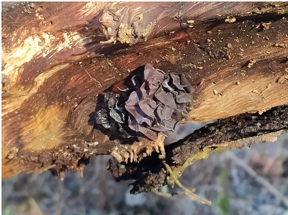
Fot. 18. Owocnik Phaeotremella frondosa WA0000167004 ( 24.02.2024). Photo 18. Basidioma of Phaeotremella frondosa WA0000167004 ( 24.02.2024).